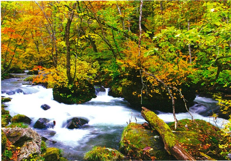
奥入瀬溪流 東京都 岩崎邦宏さんの作品