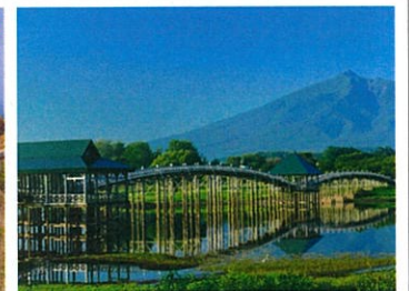
JR五能線リゾートしらかみ